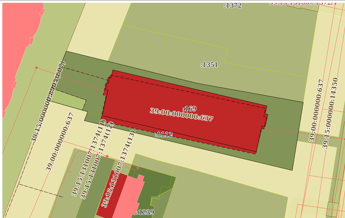
План (чертеж, схема) земельного участка