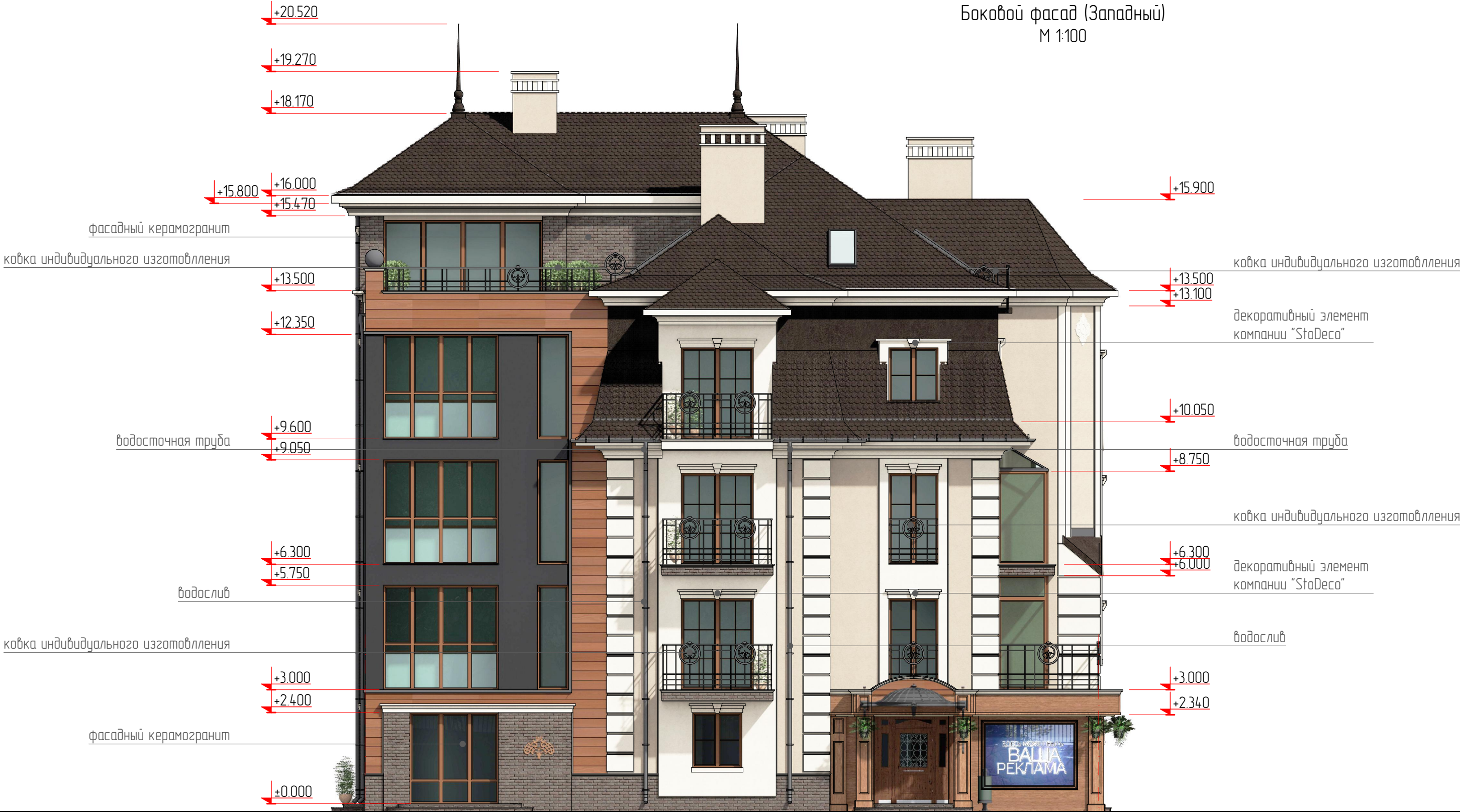
Боковой фасад (Западный) М 1:100