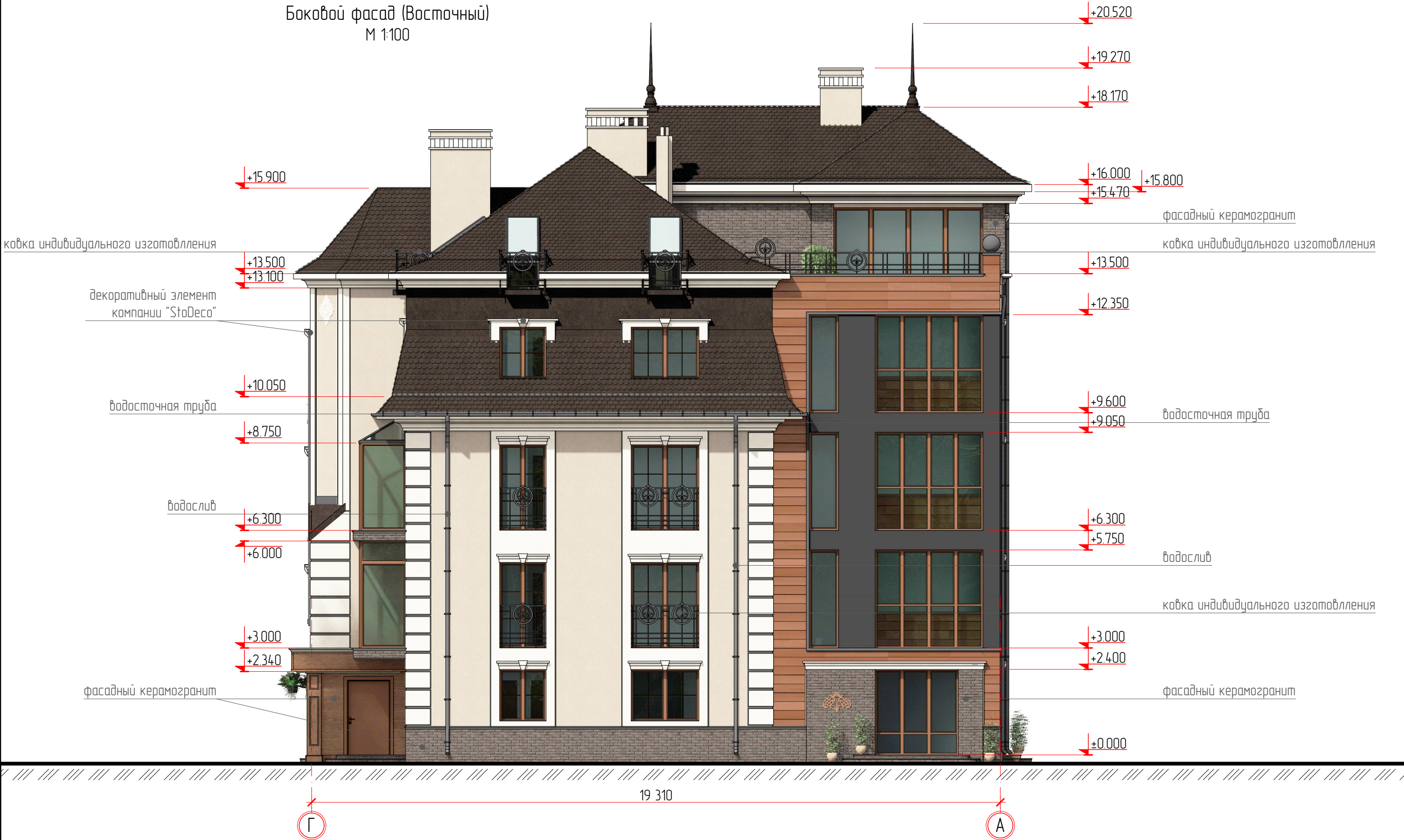
Боковой фасад (Восточный) М 1:100