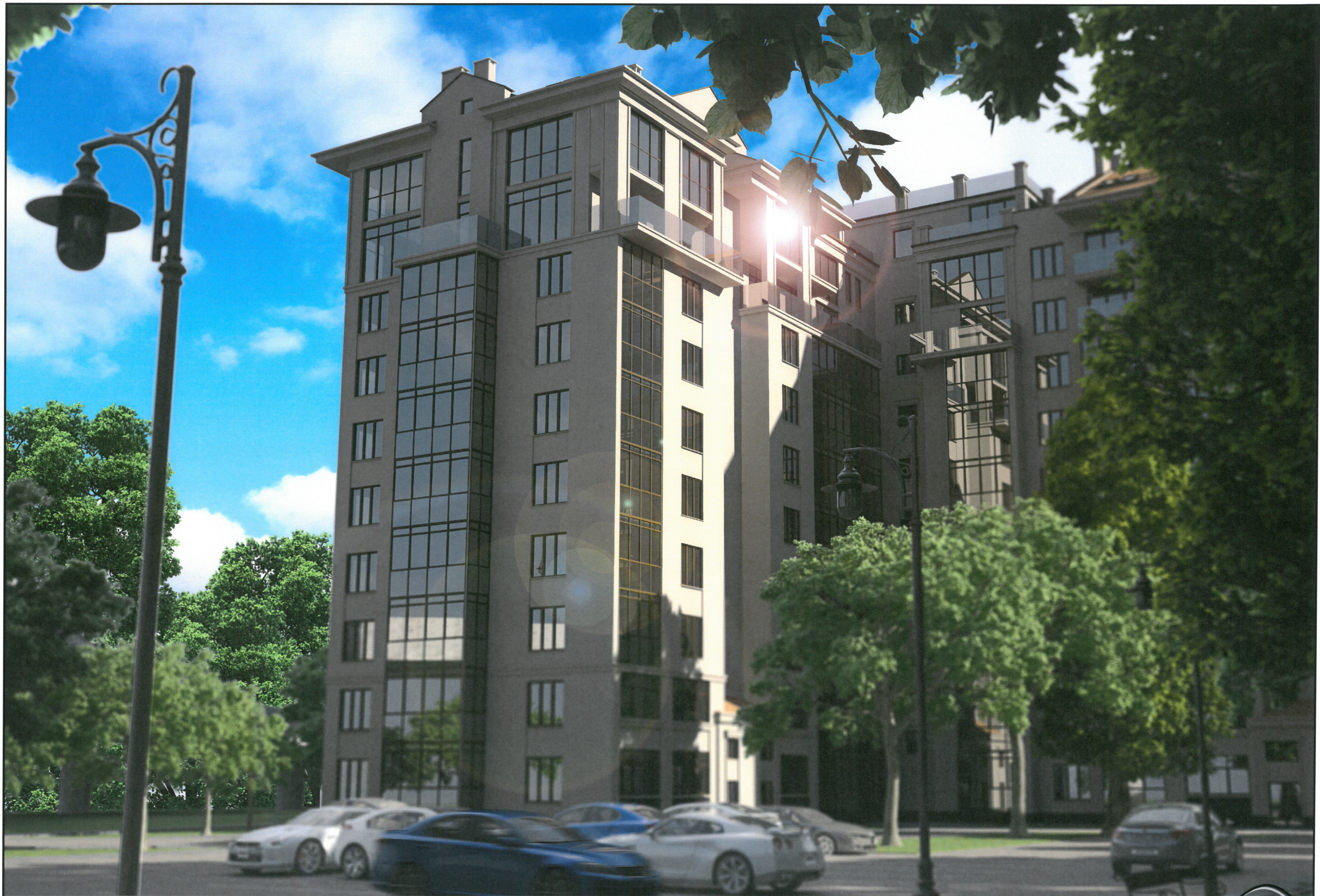
Архитектурный проект комплекса многоквартирных жилых домов по проспекту Калинина в г.Калининграде.