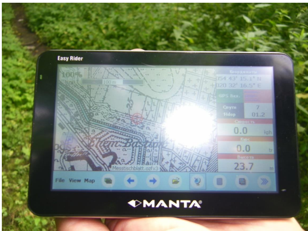
Фото 7. Отметка навигатора на карте конца 30-х годов на конце границы еврейского кладбища по кадастровому участку на карте