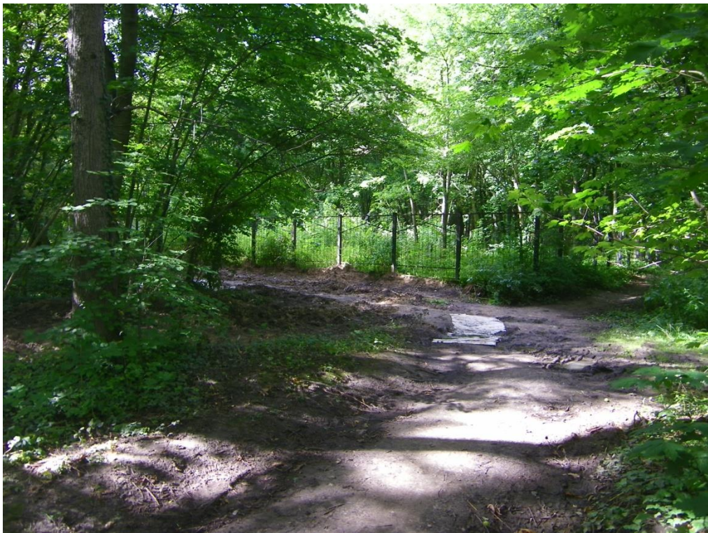
Фото 3. Угол ограждения кладбища с юго-восточной стороны и начало закопанной траншеи вдоль забора (ул. Юбилейная)