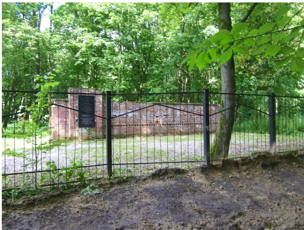
Фото 1. Памятный знак жертвам холокоста возле центрального входа на еврейское кладбище

земельного участка с кадастровым номером 39:15:132501:2476, расположенного на территории и вдоль забора еврейского кладбища, расположенного по ул. Юбилейной