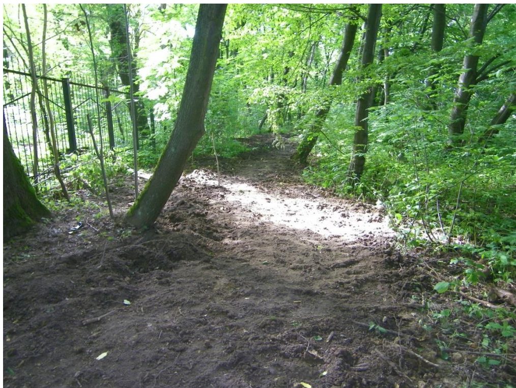
Фото 10. Вид местности закопанной траншеи на территории огороженной местности кладбища