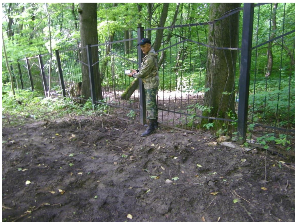
Фото 8. Вид местности с входом закопанной траншеи на территорию огороженной местности кладбища