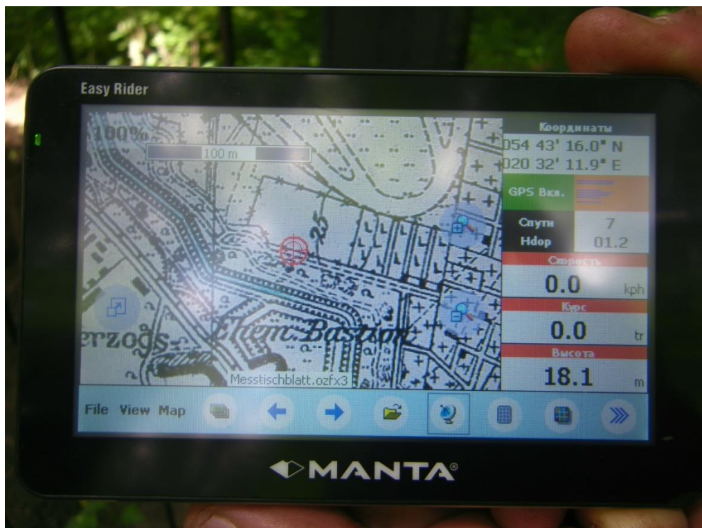
Фото 9. Отметка навигатора на карте конца 30-х годов с входом закопанной траншеи на территорию огороженной местности кладбища