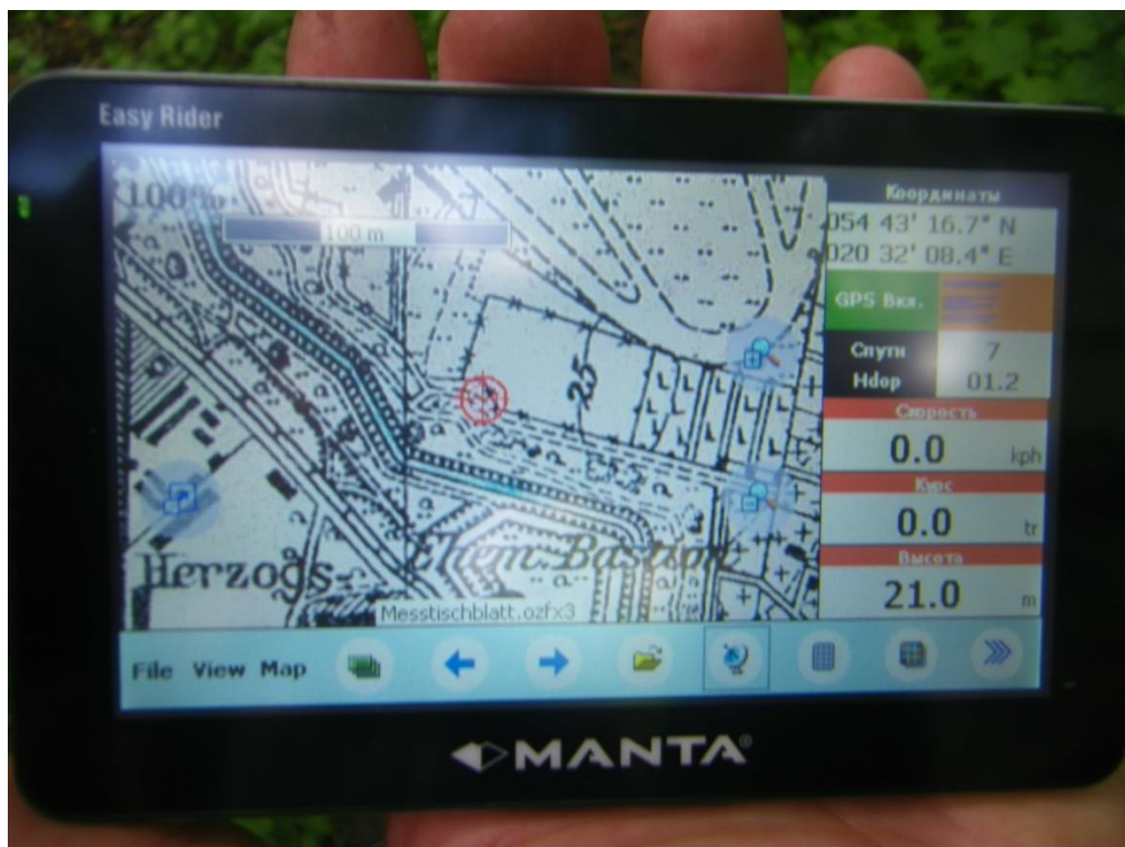
Фото 12. Отметка навигатора на карте конца 30-х годов с выходом закопанной траншеи из территории огороженной местности кладбища