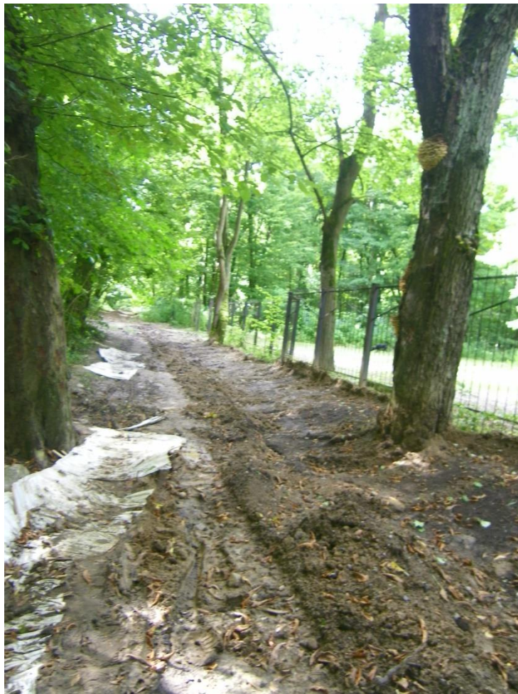
Фото 4. Вид местности вдоль забора с юго-восточной стороны в северо-западном направлении в сторону входа на кладбище (ул. Юбилейная).