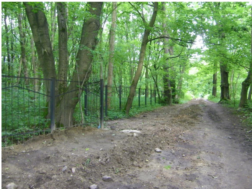
Фото 6. Вид местности в юго-восточном направлении и конец границы еврейского кладбища по кадастровому участку на карте