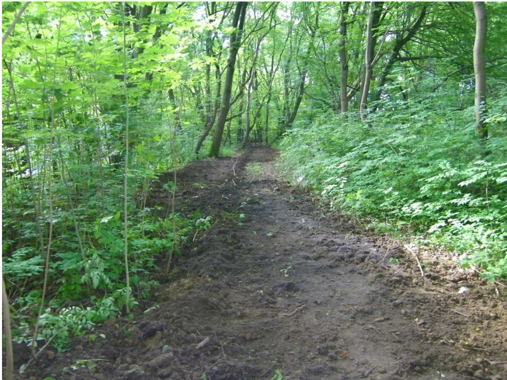
Фото 11. Вид местности закопанной траншеи на территории огороженной местности кладбища