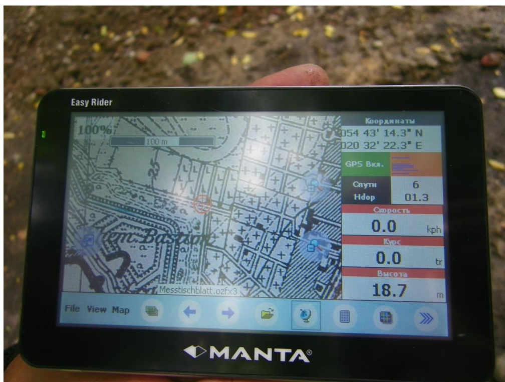
Фото 2. Отметка навигатора на карте конца 30-х годов перед центральным входом на еврейское кладбище