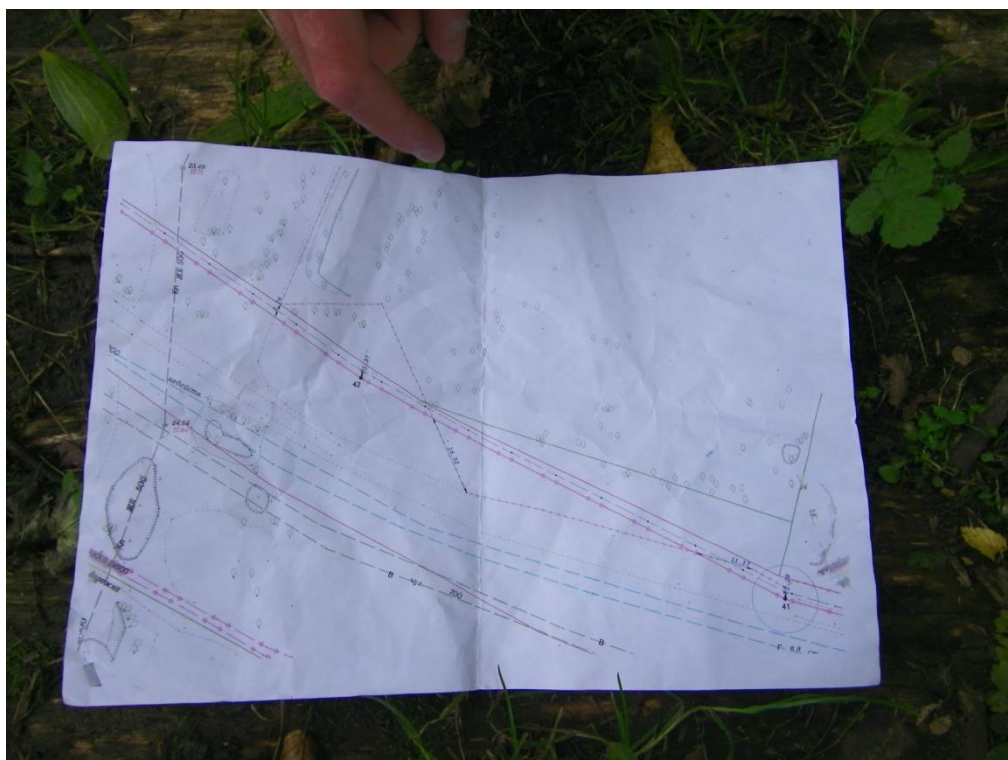
Фото 16. Схема прокладки трасс КЛ – 10 кВ вдоль забора еврейского кладбища (ул. Юбилейная)