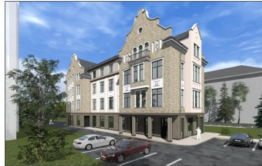
Проектное решение. Вид В