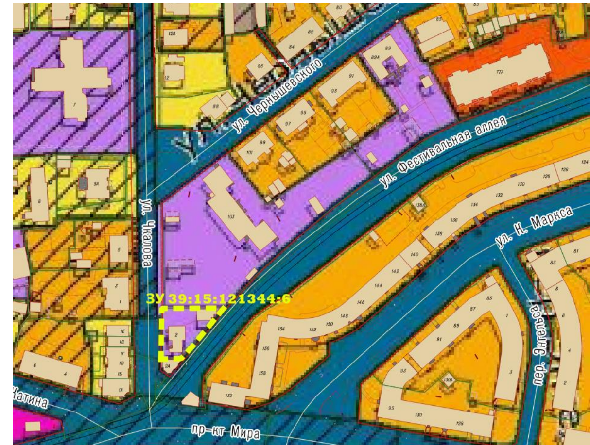
Фрагмент Правил землепользования и застройки