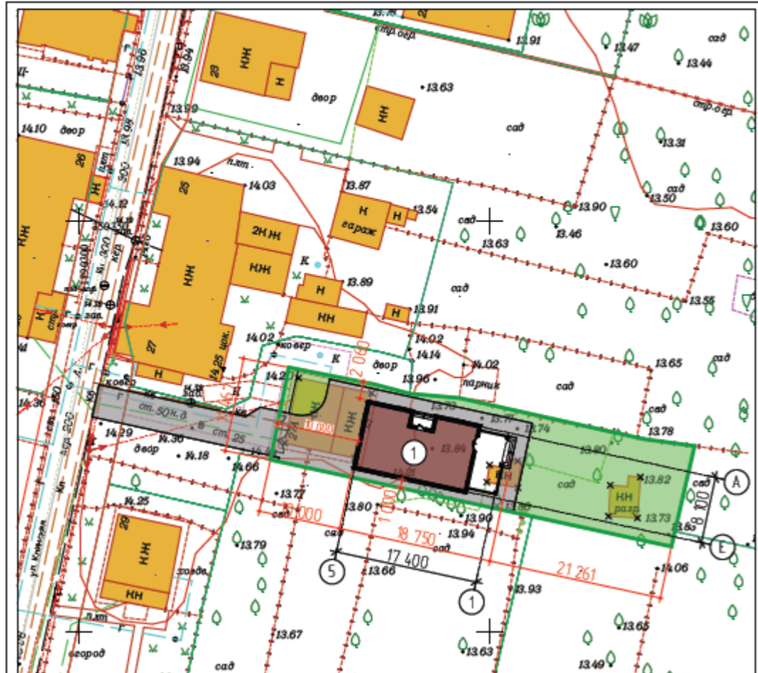
Земельный участок КН 39:15:142010:15 Местонахождение земельного участка: г. Калининград, ул.Клинская, 27А Площадь участка: 600 кв.м.

по проекту решения о предоставлении разрешения на отклонение от предельных параметров разрешенного строительства, реконструкции объекта капитального строительства в границах земельного участка с кадастровым номером 39:15:142010:15 по ул. Клинской