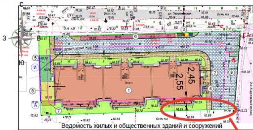
Ведомость жилых и общественных зданий и сооружений