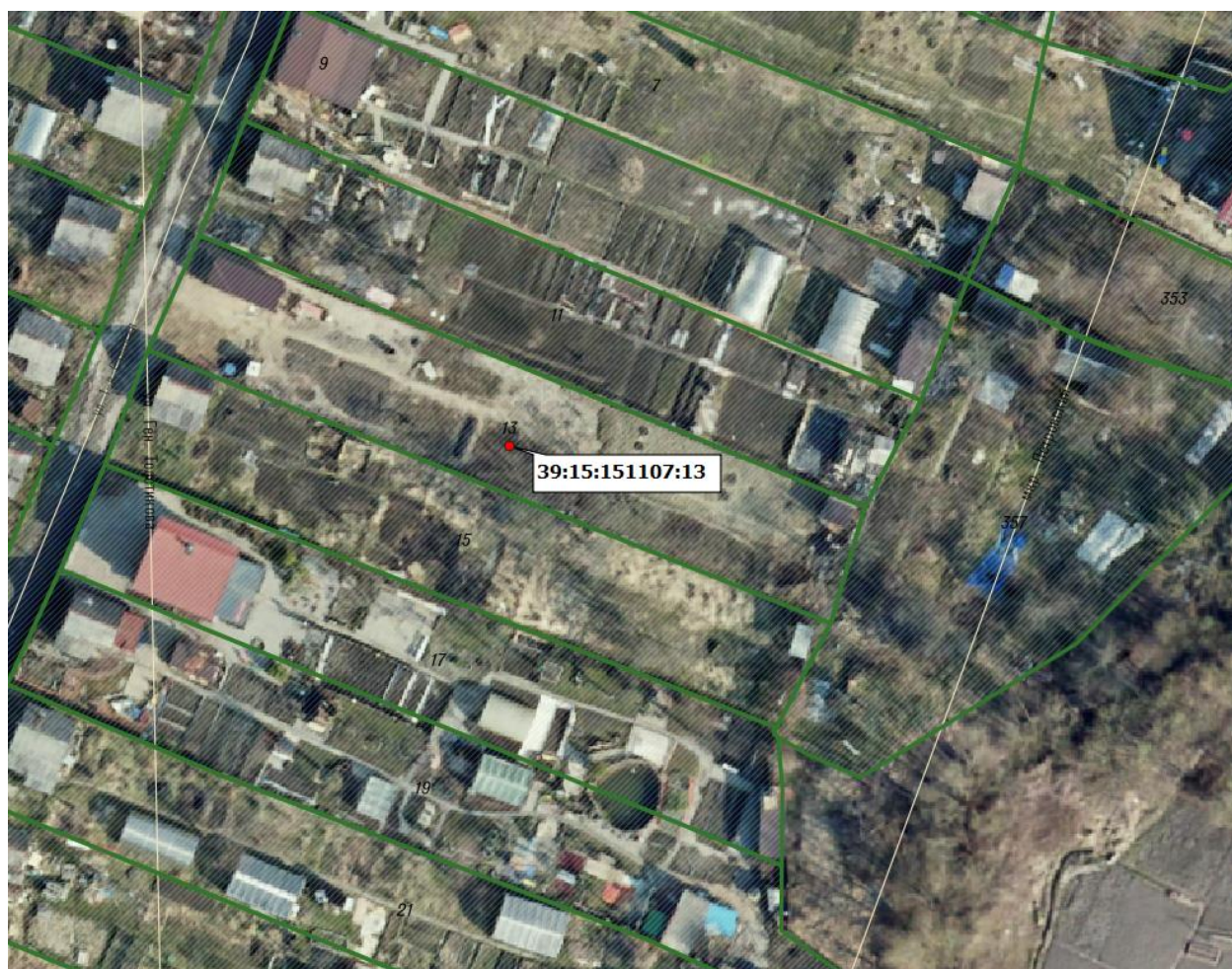
Фрагмент Правил землепользования и застройки