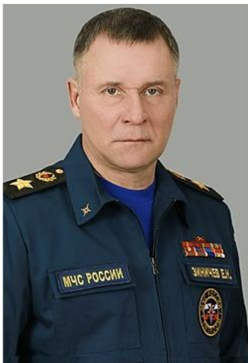
Евгений Николаевич Зиничев

(18.08.1966 — 08.09.2021) – российский государственный и военный деятель.