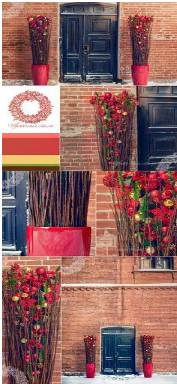
С использованием вазонов