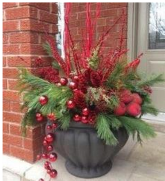
С использованием стилизованных елей