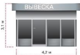
НТО Тип нейтральный