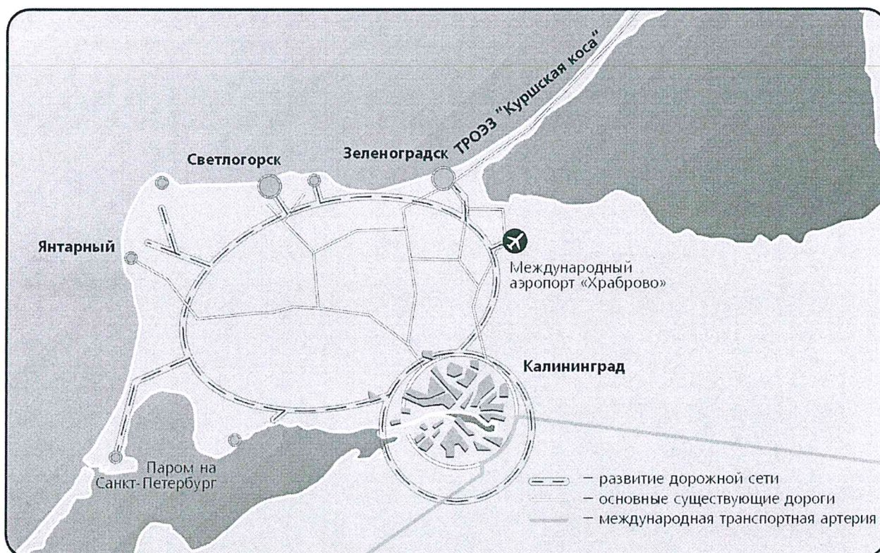
Рисунок 6. Транспортная система Калининградской области

Одним из важнейших вопросов в среднесрочной перспективе является развитие центральной части города (помечена красным прямоугольником на рис. 7), возрождение ее историко-культурного значения. С учетом значимости данной территории с точки зрения формирования «лица» города представляется неэффективным занимать ее торговыми комплексами. При воссоздании исторической (плотной) застройки острова Канта (острова Кнайпхоф, делового района) серьезным препятствием является мост (проспект Ленинский), существенно снижающий капитализацию территории острова. В целом разработка проекта планировки исторического центра города должна вестись с учетом решений, предложенных в рамках международного конкурса на разработку Концепции архитектурно-градостроительного развития территорий исторического центра Калининграда «Королевская гора и ее окружение», проходившего в Калининграде в 2013-2017 гг.