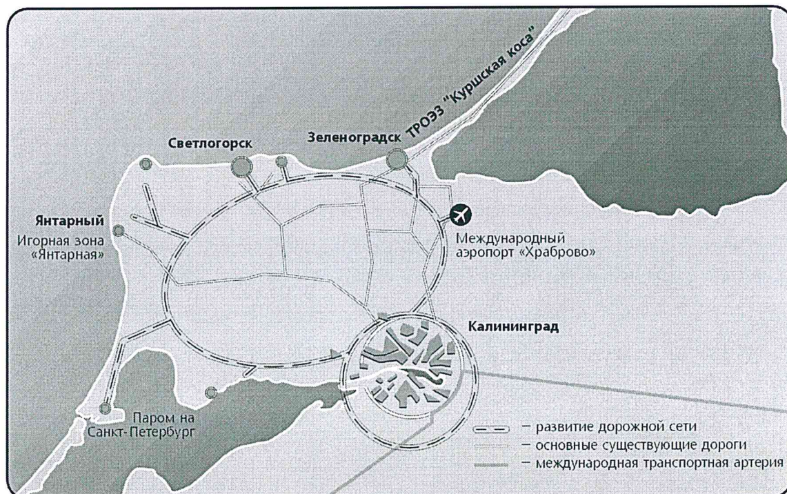
Рисунок 6. Транспортная система Калининградской области

Одним из важнейших вопросов в среднесрочной перспективе является развитие центральной части города (помечена красным прямоугольником на рис. 7), возрождение ее историко-культурного значения. С учетом значимости данной территории с точки зрения формирования «лица» города представляется неэффективным занимать ее торговыми комплексами. Для воссоздания исторической (плотной) застройки острова Канта (остров Кнайпхоф, деловой район) серьезным ограничением является мост (проспект Ленинский), существенно снижающий капитализацию территории острова. В целом разработка проекта планировки исторического центра города должна вестись с учетом решений, предложенных в рамках международного проектного семинара (так называемого workshop'a), проходившего в Калининграде в 2007-2008 г.г.