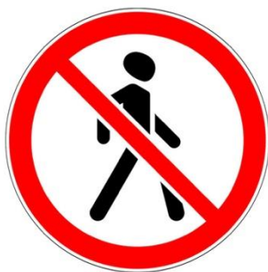
1. Движение пешехода запрещено