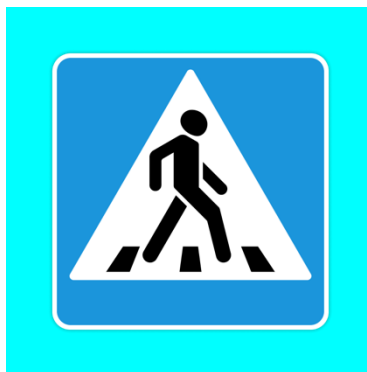
2. Пешеходный переход