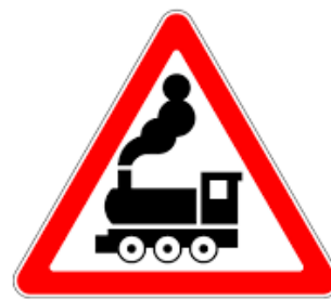
3. Железнодорожный переезд без шлагбаума

Билет на «ШОУ мыльных пузырей» стоит для взрослого 600 р., а для школьника – половину стоимости взрослого билета, а для дошкольника – четверть стоимости взрослого билета. Сколько рублей должна заплатить за билеты семья, включающая двух родителей, двух школьников и одного трехлетнего малыша?