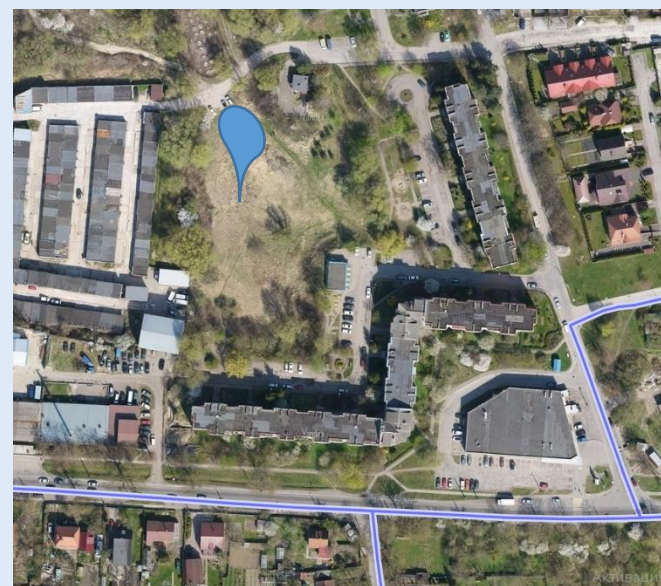
Местоположение детской площадки