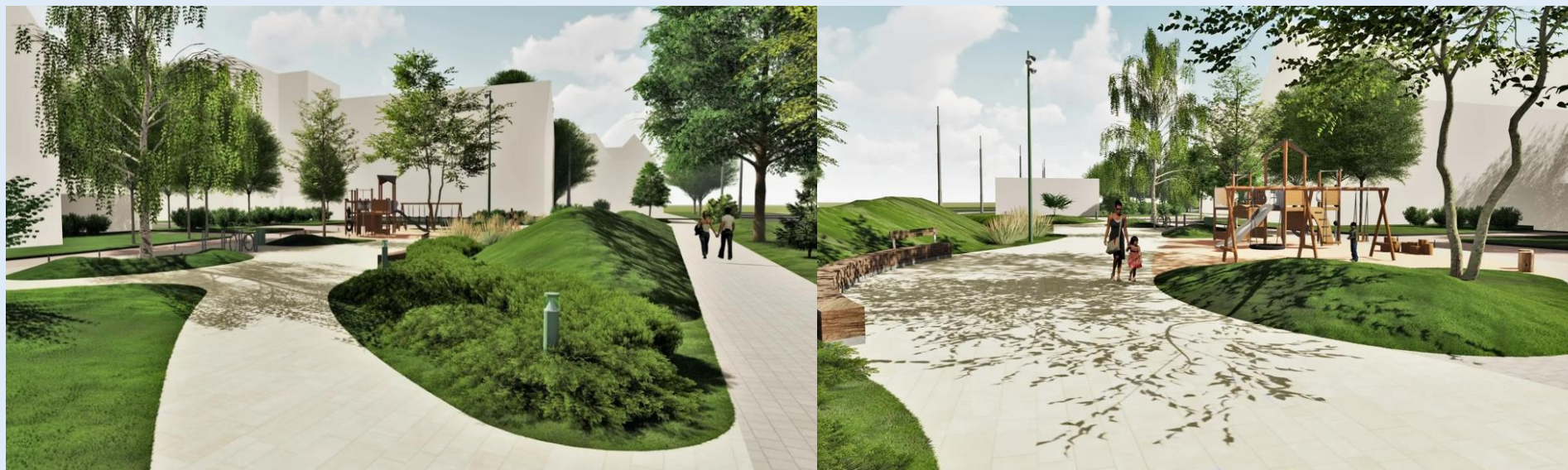
Визуализация предпроектных решений

Реализация проектных решений позволит повысить комфортность проживания в районе ул. Марш. Борзова.