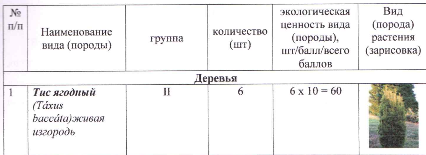
Таблица № 2

Экологическая ценность вида (породы) высаживаемых зеленых насаждений