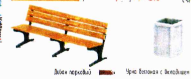
Диван парковой Черна бетонная с окладом

искусственная неровность - лекачок полицейский