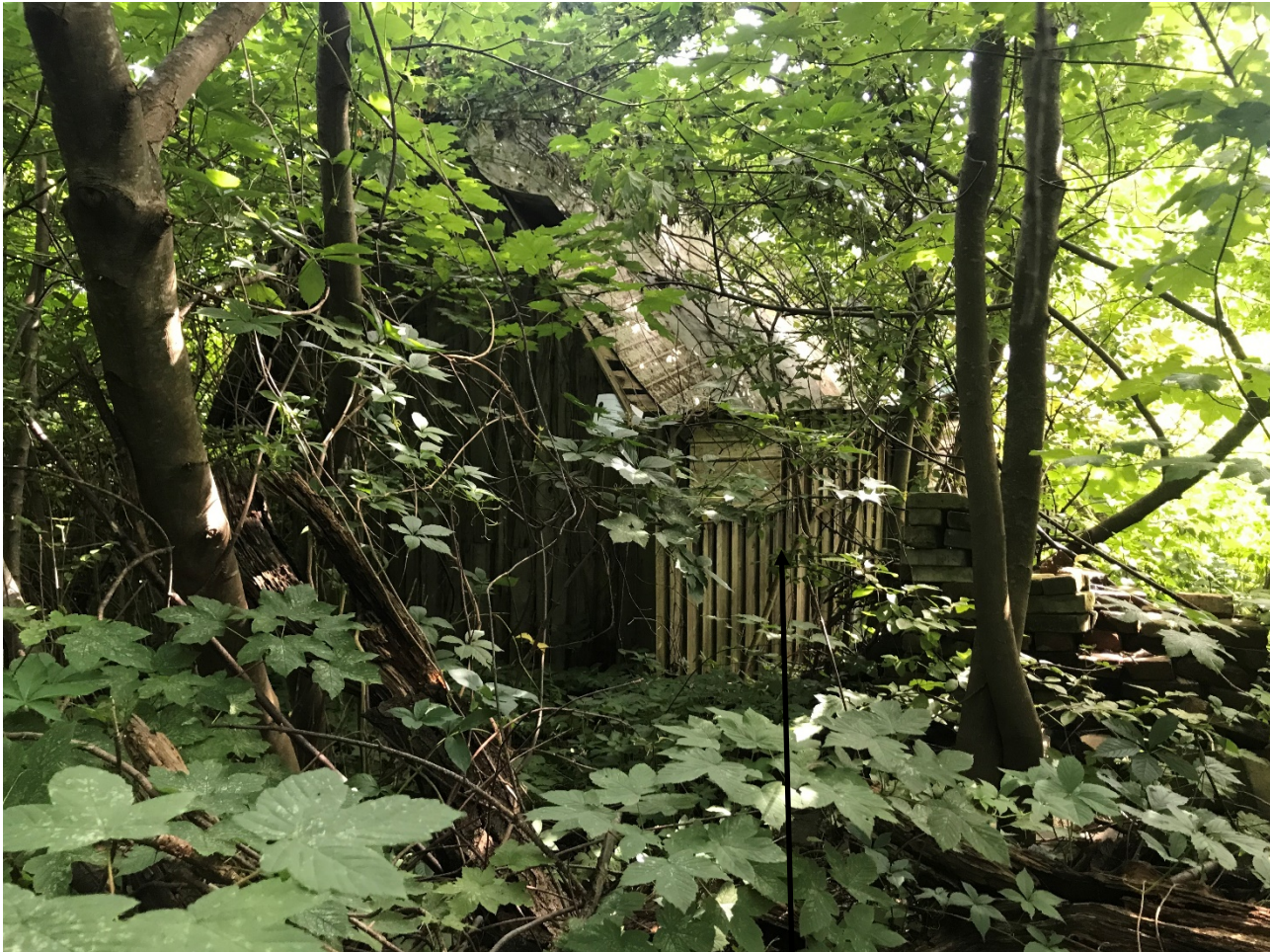
самовольно возведенное строение