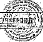
Схема границ публично-сервитута ООО "ТЕОИД"

Заявка № 03163 Калининград, Инициалы Т.И. _____ Домовладение, Фамилия _____ Подпись _____