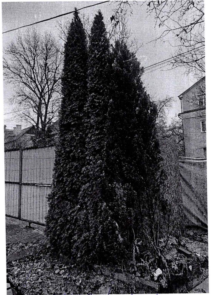
N 155, N 139 | N 138