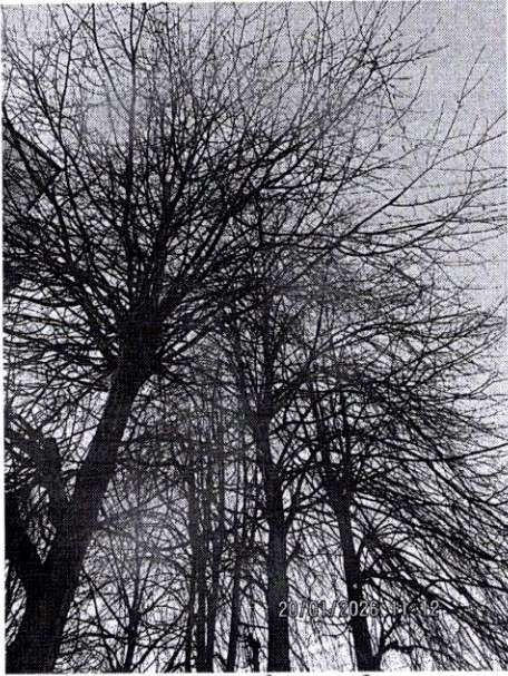
1 2 3