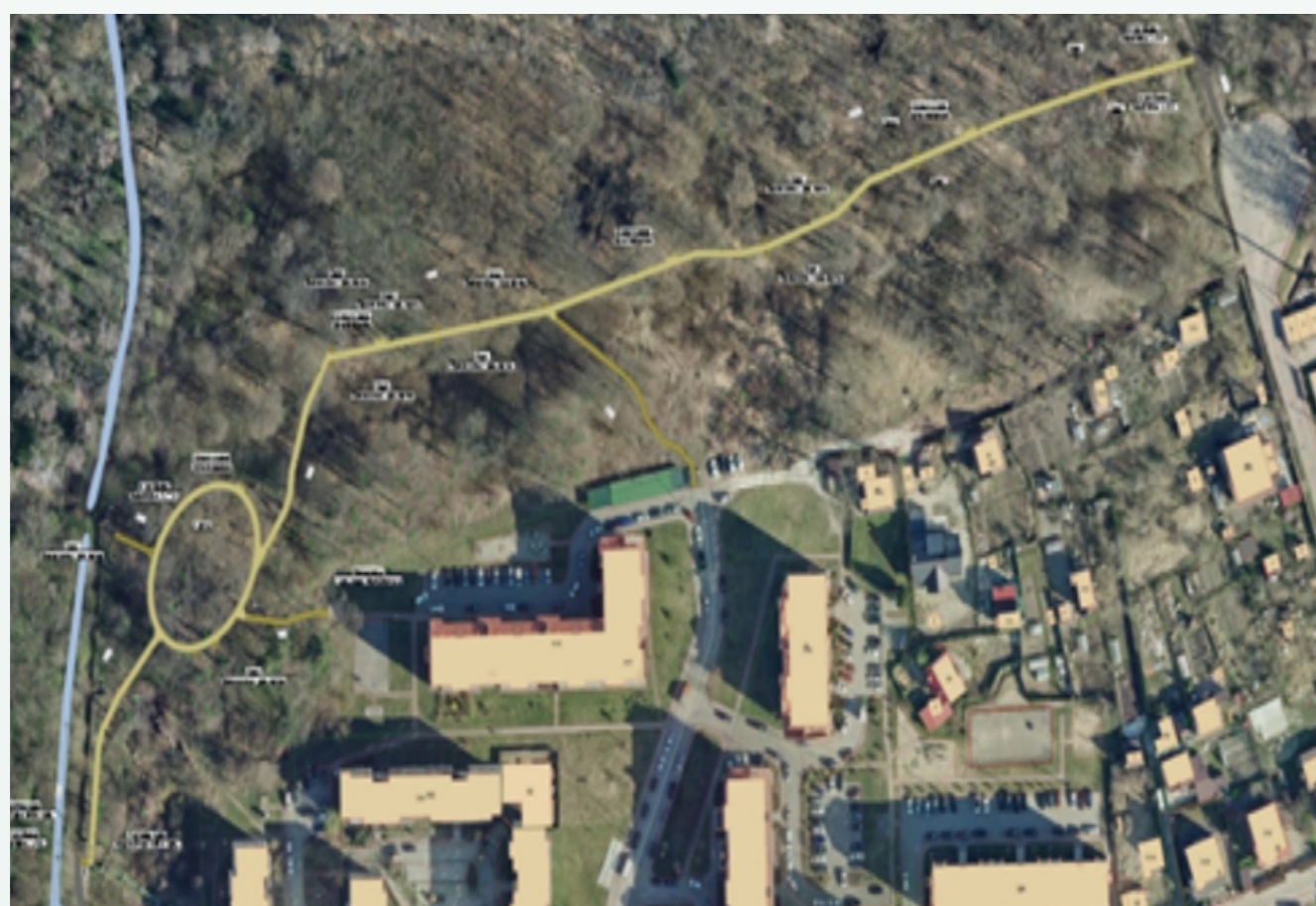
Маршрут Тропы здоровья

На всем протяжении экотропы предусмотрены пандусы (спуски), выполненные для удобного схода для прогулки по лесу. Предполагаемая протяженность маршрута составляет 780 м, дорожки устроены из деревянного настила и гравийного покрытия. Вдоль маршрута предполагается установка малых архитектурных форм (скамьи, урны), а также организация освещения.