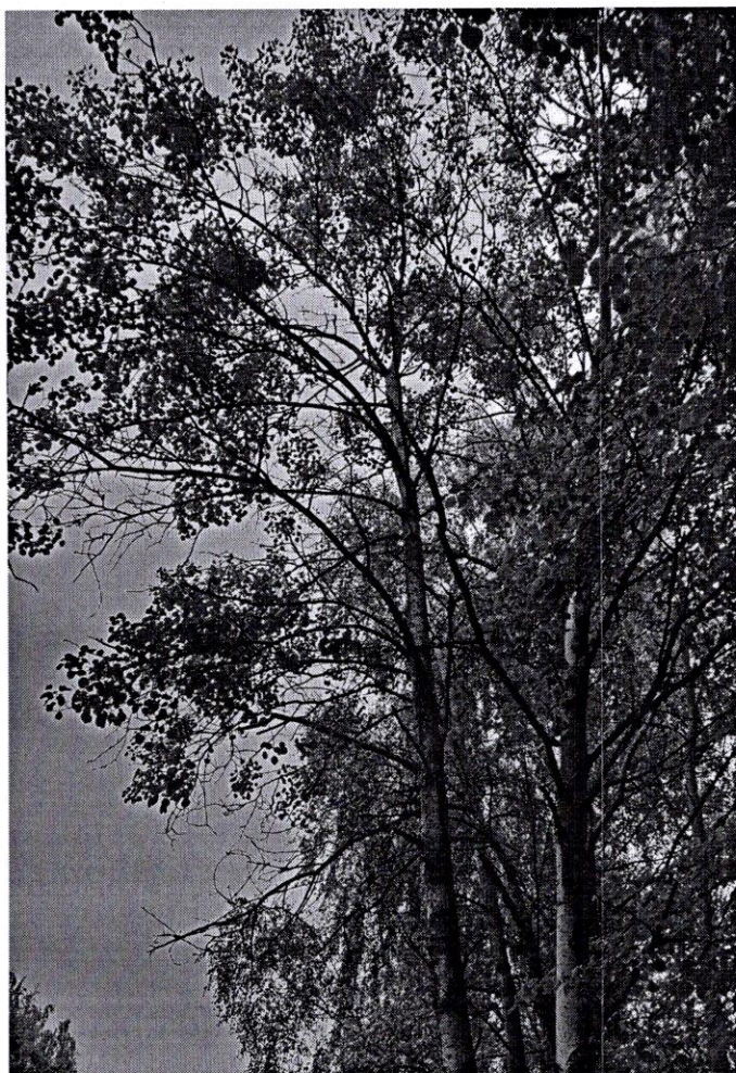
30230, 30 229