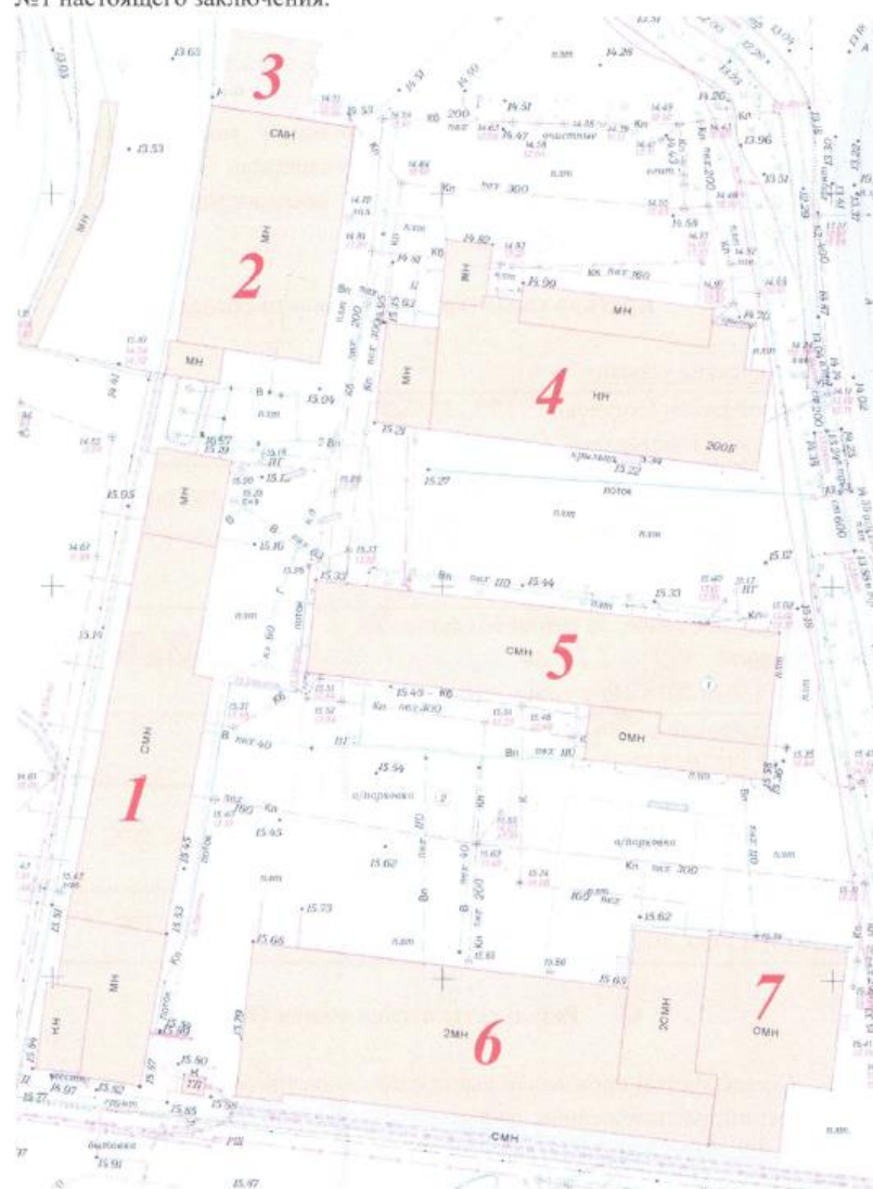
Рис.1. Расположение объекта обследования.

В ходе обследования произведен визуально-инструментальный осмотр объекта экспертизы, произведена фотофиксация, представленная в приложении №1 настоящего заключения.